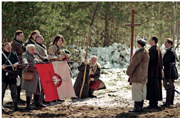
Uroczystość w Boruczy rozpoczęła się od inscenizacji bitwy, która odbyła się w tym miejscu podczas Powstania Styczniowego.

Oprawę muzyczną mszy zapewniła orkiestra wojskowa z Warszawy oraz Chór Miejski „Lux Mea” z Tłuszcza. Kolejnym punktem uroczystości były przemówienia oraz złożenie wieńców pod pomnikiem bohaterów Powstania Styczniowego w Boruczy. Głos zabrał również wójt Gminy Jadów, który odczytał list Prezydenta RP Bronisława Komorowskiego. Obecna była również reprezentacja Wojska Polskiego, która przeprowadziła Apel Poległych i oddała salwę honorową. Na zakończenie mieliśmy okazję obejrzeć występy przygotowane przez uczniów. (jw)